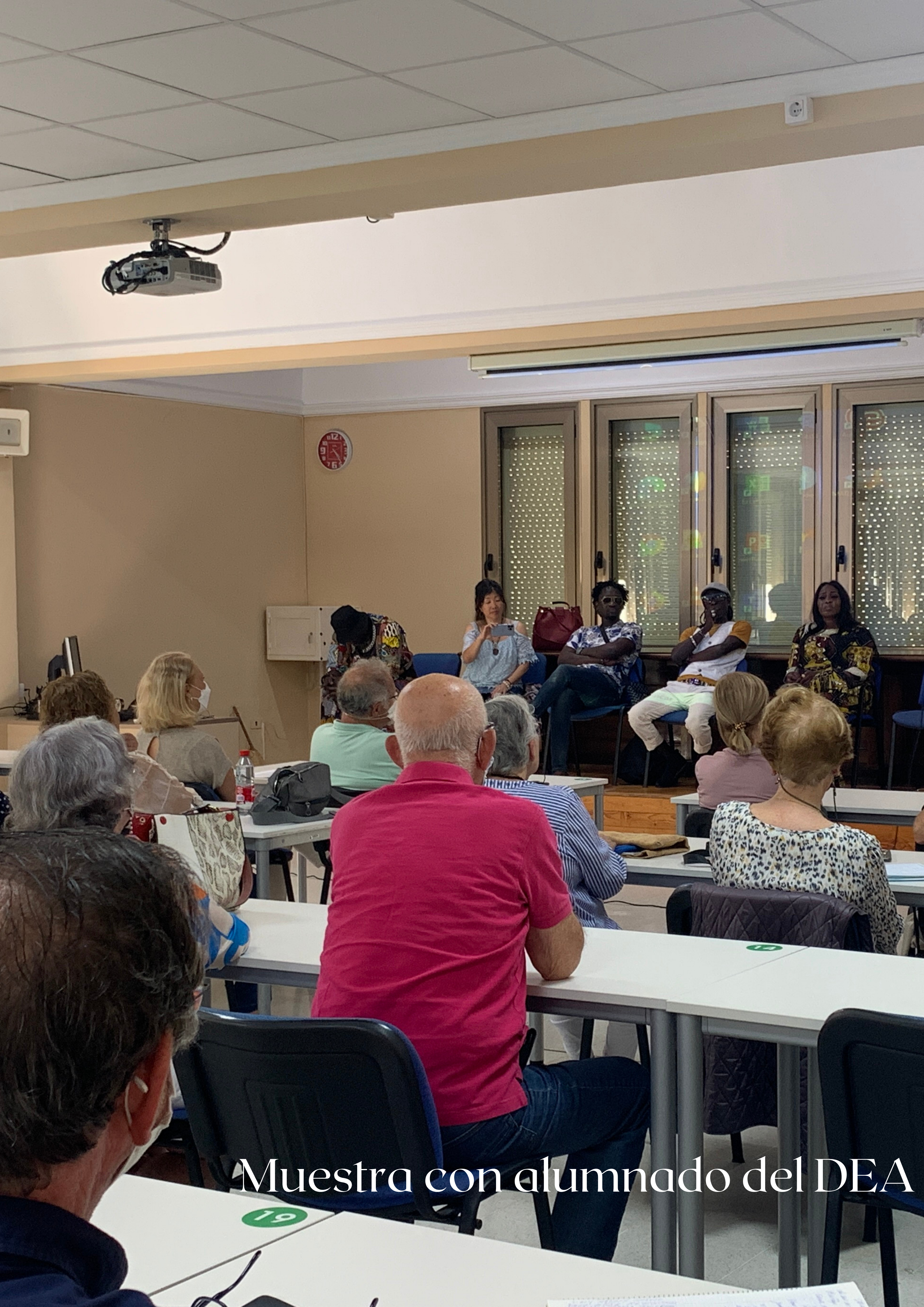
Muestra con alumnado del DEA