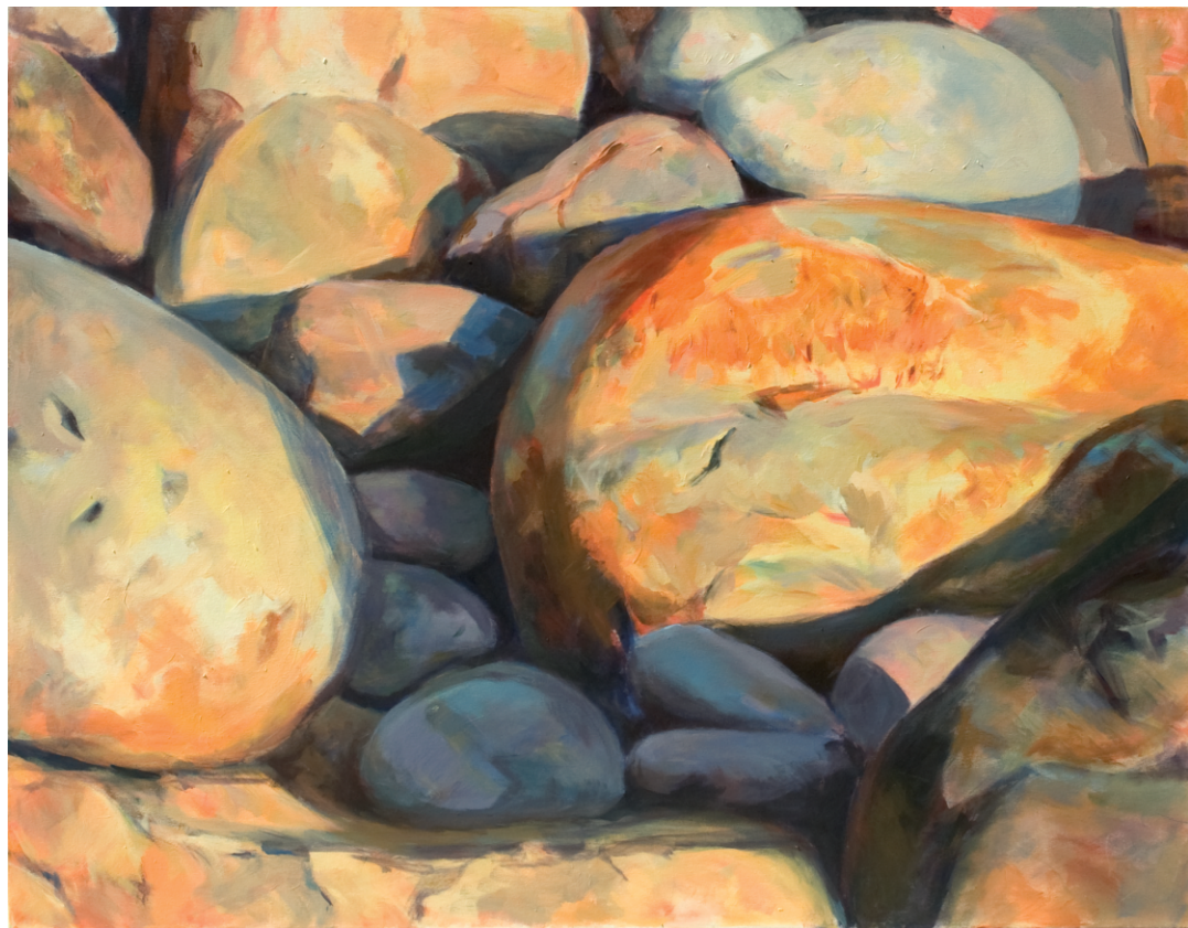
“Sin título”, 2011. Acrílico sobre lienzo 146 x 114 cm.