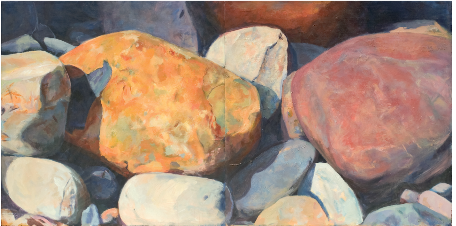
"Sin título", 2011. Acrílico sobre madera. 244 x 122 cm.