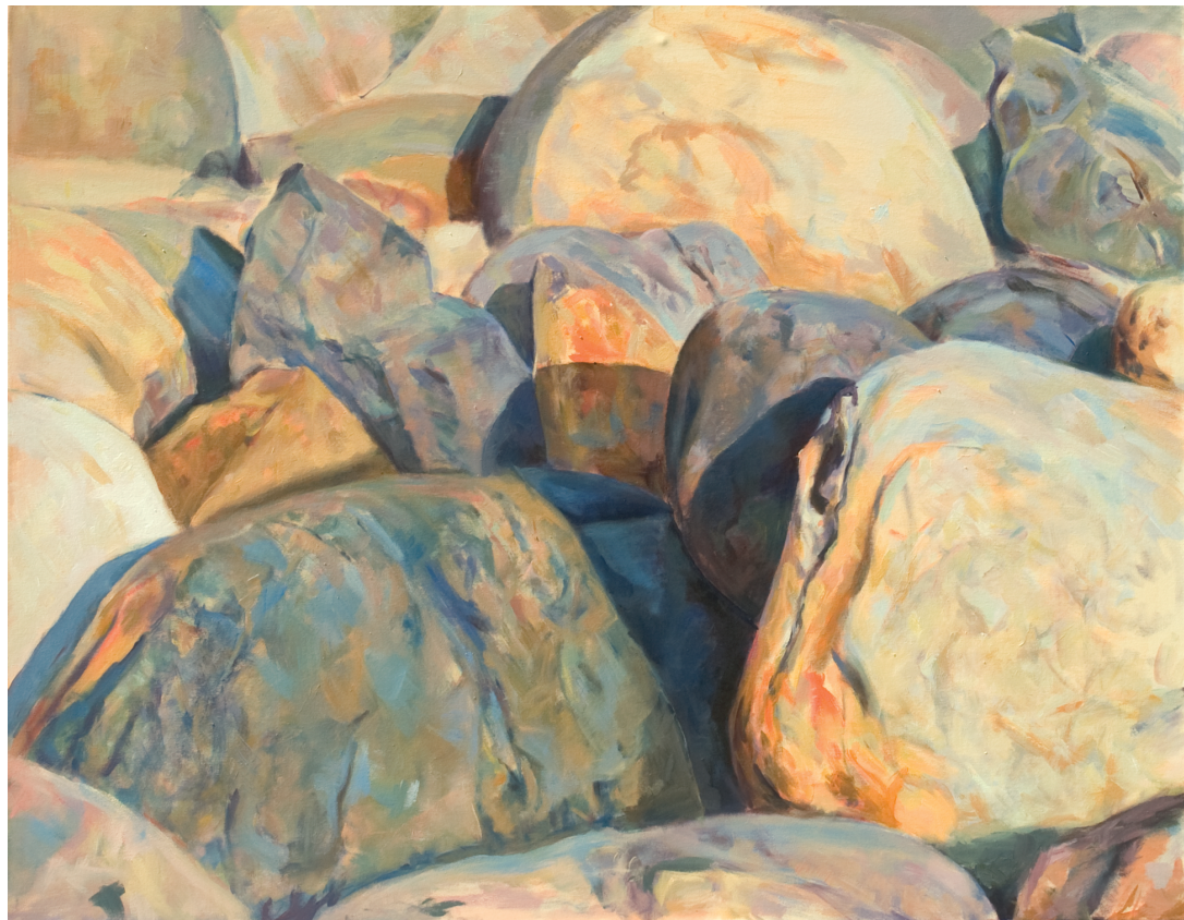
"Sin título", 2011. Acrílico sobre lienzo 146 x 114 cm.