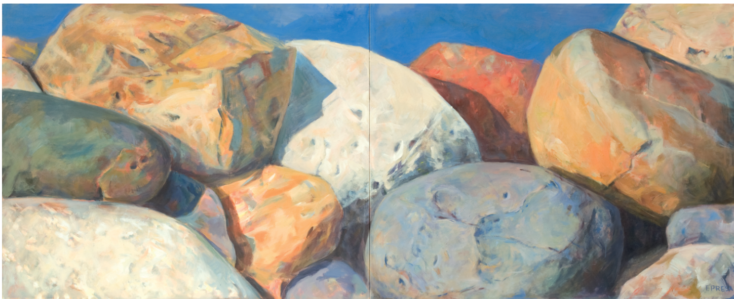
“Sin título”, 2011. Acrílico sobre lienzo, díptico 320 x 130 cm.